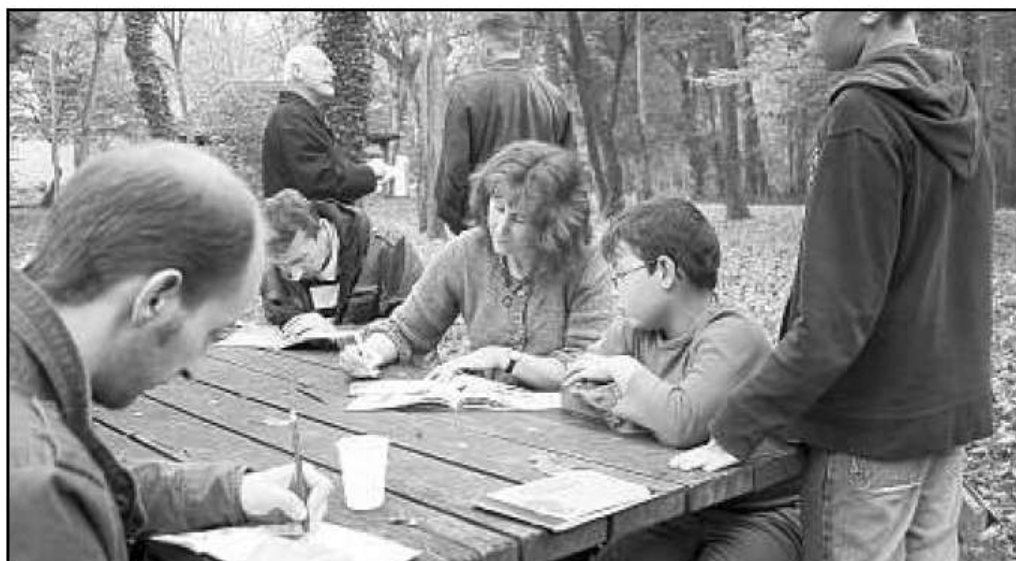
Les enfants du club nature ont découvert le livret lors d'une séance de dédicace avec les illustrateurs, mercredi au Neuland.