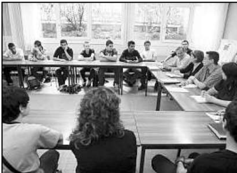
Des élèves conscients de l'importance de la nature en ville.

Arnaud Roquebernou, de l'Observatoire, a, en outre, présenté un projet de création d'espaces de plantes aromatiques et de fleurs des champs, ou encore l'installation de gîtes pour insectes et de nichoirs à oiseaux dans les espaces verts.