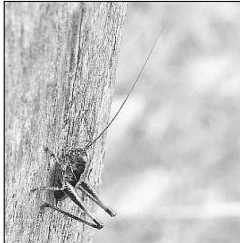
Rendez-vous avec les orthoptères.

Mercredi 6 août à 14 h (fin de la sortie à 17 h) ; participation libre sur réservation à l'accueil du camping de l'Ill à Horbourg-Wihr, 03.89.41.15.94.