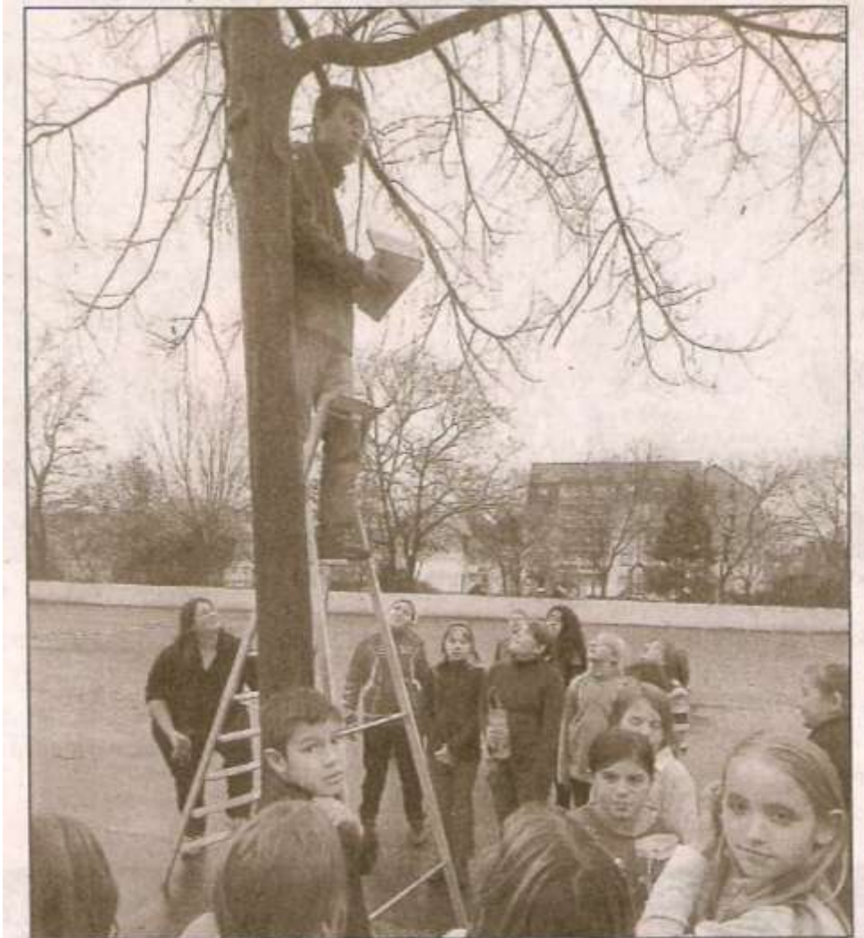
Les élèves de l'école Maurice Barrès ont agrémenté la cour de cinq nichoirs.