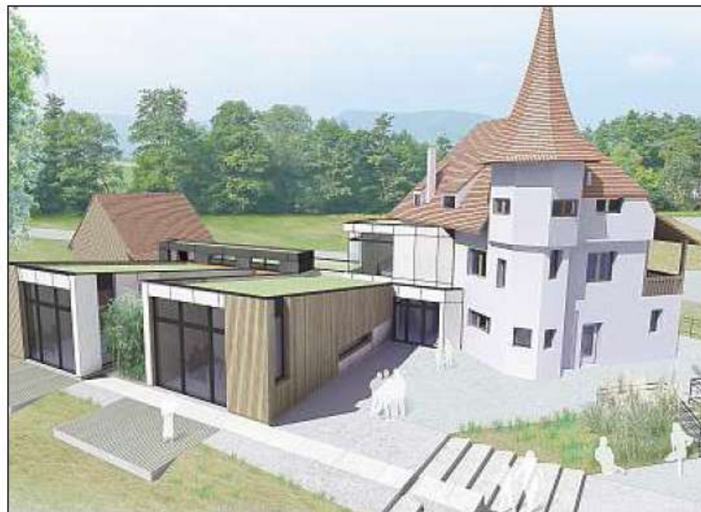
La bâtisse rénovée et l'annexe neuve, telles qu'elles ont été imaginées par l'agence K'nL architecture.

« Ce ne sera pas une maison dans la nature, mais bien une maison de la nature ». Une vue ambitieuse qui conduira probablement à renforcer l'équipe actuelle, déjà fort active, de deux salariés.