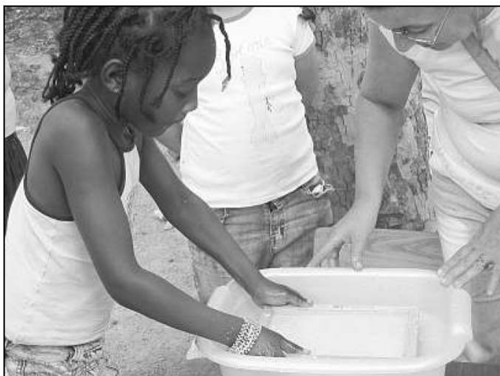
Travaux pratique pour une trentaine d'enfants.

Dans le cadre des animations de rue du Club de prévention Europe, l'Observatoire de la nature a permis à une trentaine de jeunes de découvrir où se niche la biodiversité dans le cycle de vie du papier (de l'exploitation forestière au recyclage).