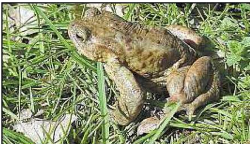
Au programme des 8-11 ans, du 15 au 18 juillet : « Crapauds, grenouilles et cie ».

Dans le cadre des animations de l'été, l'Observatoire de la nature propose dix stages pour découvrir la faune et la flore de la forêt du Neuland au travers d'activités ludiques, sensorielles, scientifiques et artistiques.