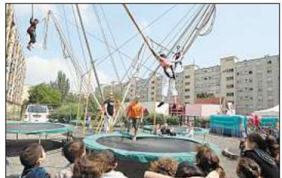
Du saut à l'élastique était proposé, mais pas uniquement. Outre la vingtaine de bénévoles du CSC Florimont Bel-Air, de nombreuses associations étalent de la partie, pour proposer une petite restauration, des jeux du monde, avec Caritas, l'ASTI et ATD-Quart Monde qui accueillent les enfants mais aussi les parents, selon une « demande des habitants du quartier », ou une animation sur la biodiversité. Des photos de précédentes fêtes étaient exposées. En outre, pour la première fois, un thé dansant était organisé à l'attention des plus âgés, dans la salle Saint-Vincent-de-Paul.