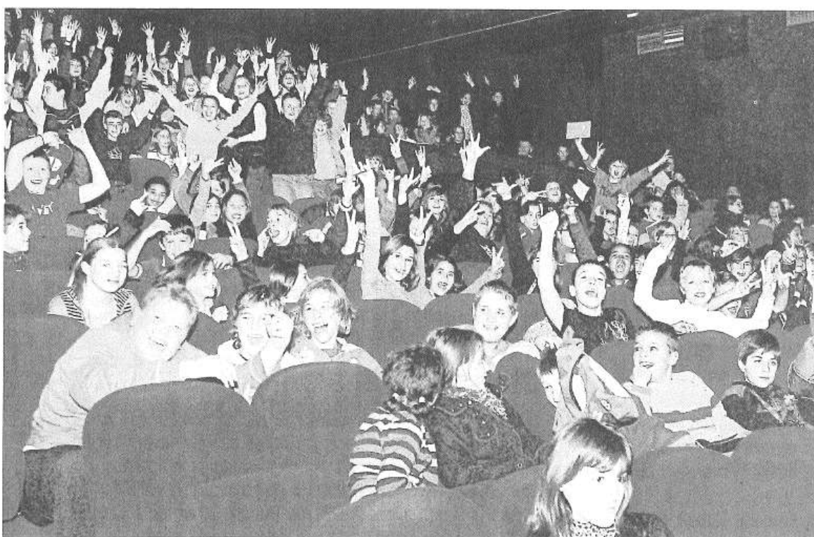
Un public jeune et nombreux s'est intéressé à l'environnement.

■ Dernièrement, au cinéma de Colmar se déroulait une séance inédite.