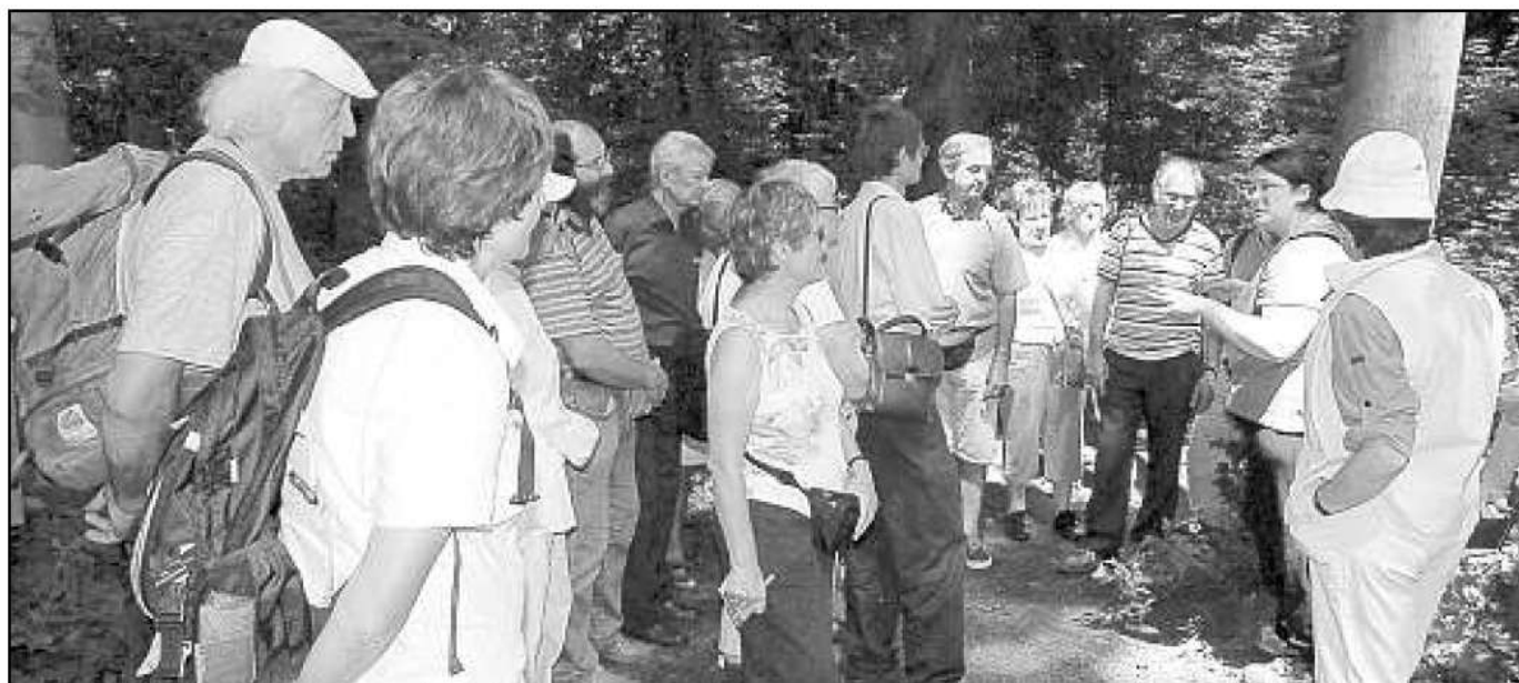
Les Amis de la bibliothèque écoutant les explications de leur guide.