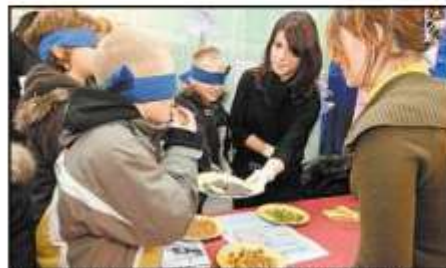
Dégustation à l'aveugle des saveurs d'Europe pour les petits visiteurs, au stand du lycée du Rebbegg, de Mulhouse.