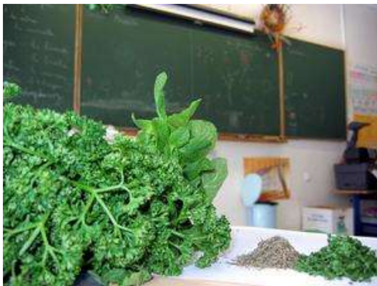
Persil, menthe, ciboulette, thym... n'ont plus de secret pour les jeunes élèves.

Pour leur première séance avec l'animatrice de l'Obser-