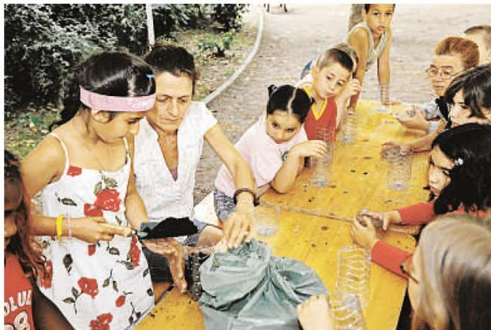
Les enfants des zones urbaines sensibles (ZUS) s'initient à la biodiversité.