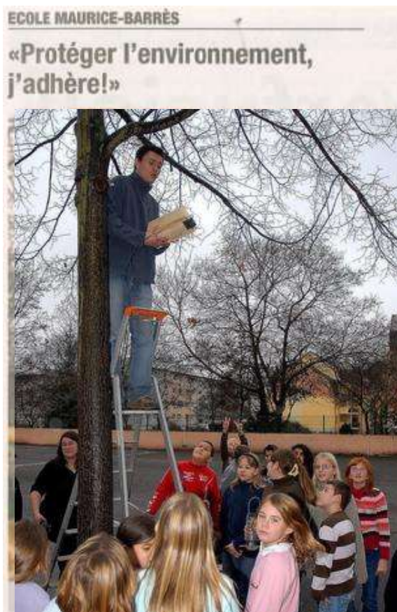
Point d'orgue du projet: l'installation de nichoirs à oiseaux dans les arbres de la cour d'école.

Un projet de classe intitulé «Protéger l'environnement, j'adhère», financé par l'Ariena, à l'école Maurice-Barrès de Colmar, en partenariat avec l'Observatoire de la nature de Colmar, a abouti concrètement jeudi après-midi par des aménagements dans le jardin de «Maurice».