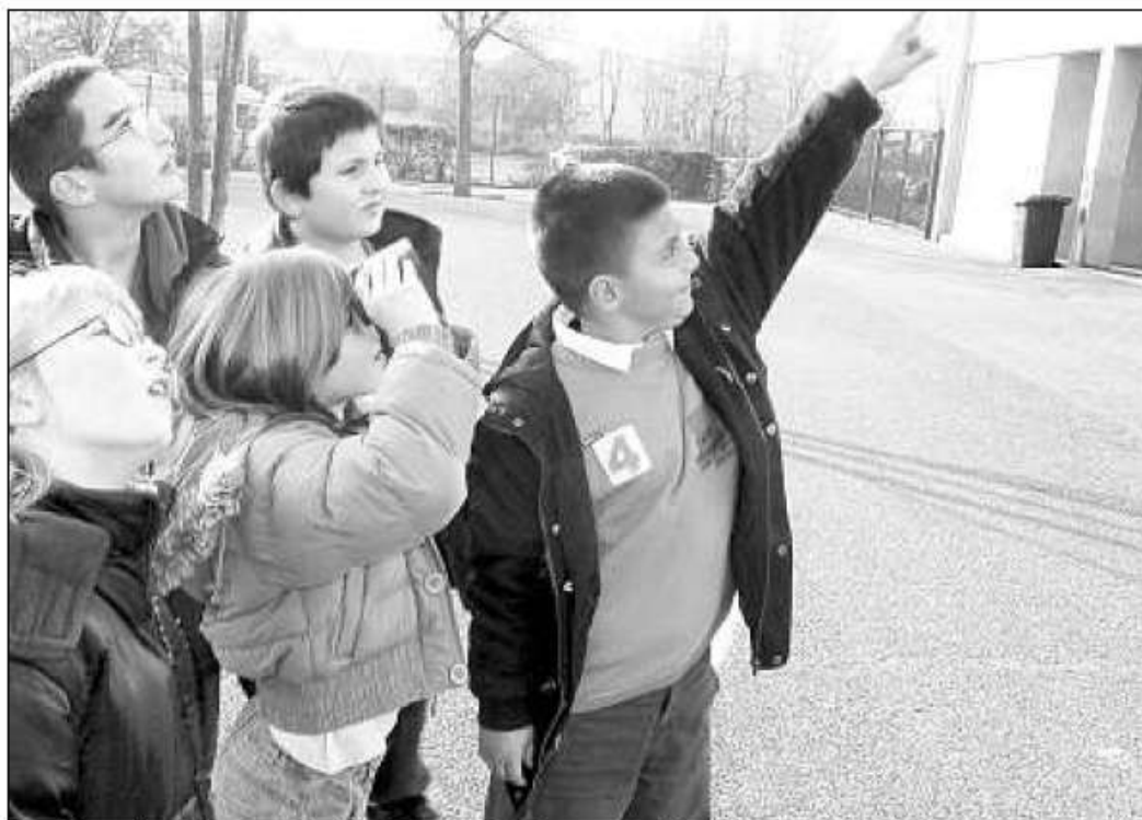
Des élèves de CE2 se sont familiarisés avec les oiseaux peuplant leur cours d'école.