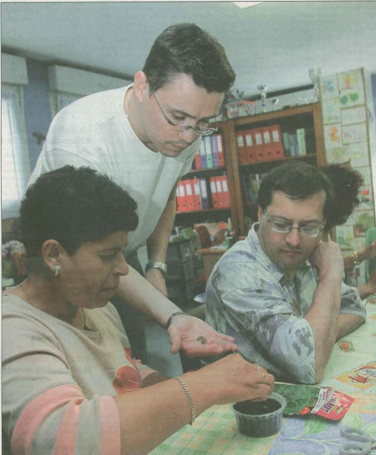
Herbes aromatiques passées en revue, semis plantés en pots... Une séance de jardinage avec l'Observatoire de la nature, dans les locaux de Quartier nord.

L'Observatoire de la nature de Colmar mène diverses animations consacrées aux micro-jardins et à l'art d'entretenir la nature au cœur de l'espace urbain. Avec des adultes, comme le groupe de La Croisée des chemins, ou des élèves du collège Molière, l'objectif est de rappeler les enjeux de la biodiversité et d'inciter chacun à