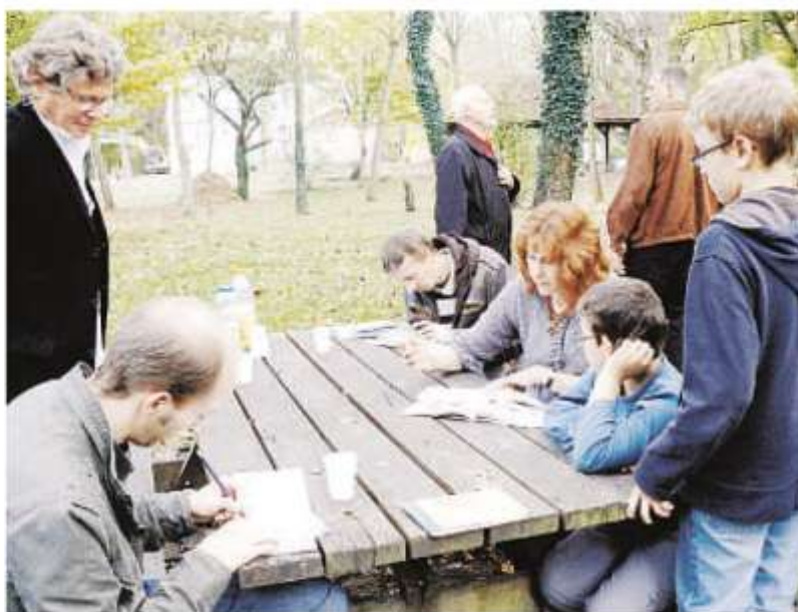
Mercredi dernier, au cœur de la forêt du Neuland, les illustrateurs ont dédicacé le livret bilingue. (Document remis)

Dans le cadre de cette coopération transfrontalière, dif-