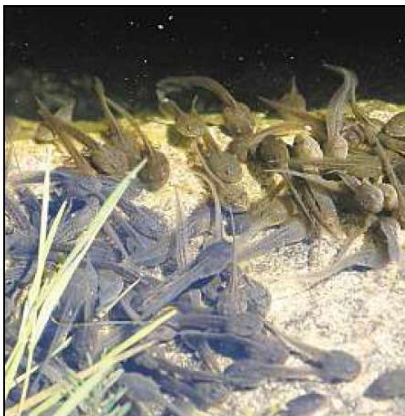
Les enfants sont invités à observer l'évolution des têtards.

Il y a quelques mois, les enfants avaient fait la « traversée périlleuse » pour permettre aux batraciens de traverser les routes et de rejoindre leurs lieux de ponte. Après avoir dernièrement observé les œufs des batraciens et les jeunes têtards, les enfants découvriront comment ces derniers ont évolué. Et feront connaissance avec les autres habitants de la mare : des larves de libellules et d'éphémères, des insectes nageurs. À partir de 7 ans, de 13 h 30 à 17 h 30, en forêt du Fronholz. Tél. : 03.69.99.55.63.