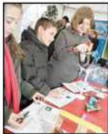
A la découverte de l'énergie solaire sur le stand EDF.