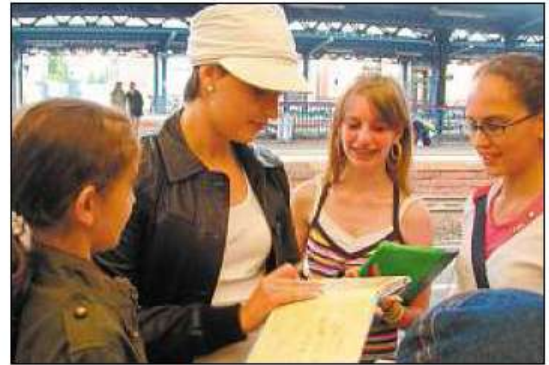
Une poignée de jeunes filles seulement, accompagnées de leur maman, avaient eu vent de l'information. Hier matin, lorsque leur chère Sheryfa Luna, est descendue du TGV en gare de Colmar, elles l'ont accueillie sur le quai, l'appareil photo à la main. La vedette R & B a gentiment joué le jeu, réceptionnant les dessins chargés de cœurs, dédicçant disques et cahiers de souvenirs... Avec l'équipe du CSC Florimont Bel-Air, elle a ensuite dégusté des spécialités marocaines dans un restaurant qui n'a ouvert ses portes que pour elle...