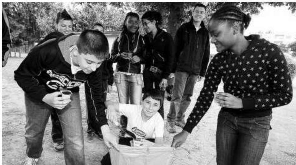
Collégiens et bientôt jardiniers dans la ville.