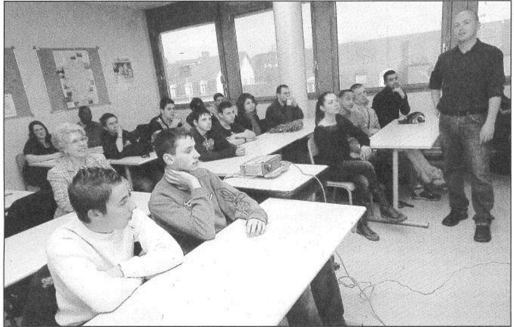
Après la visite du quartier Europe et du Palais Royal, les élèves de seconde BEP se sont retrouvés à Blaise Pascal pour faire le point.