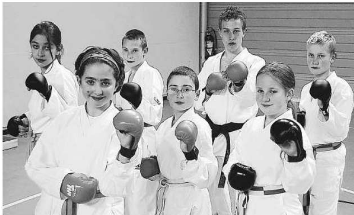
Les stages de karaté sont proposés de 5 à 17 ans.

Les tarifs s'échelonnent de 13,50€ (handball, judo) à 150€ (vol à voile, camp itinérant en canoë-kayak) pour les résidents des communes de