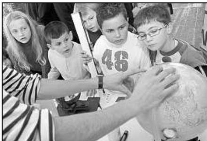
La fête de la science s'adresse en premier lieu aux enfants.