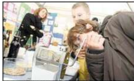
Au stand du lycée agricole de Rouffach, pour faire de la bonne bière, il faut de l'orge bien moulue !