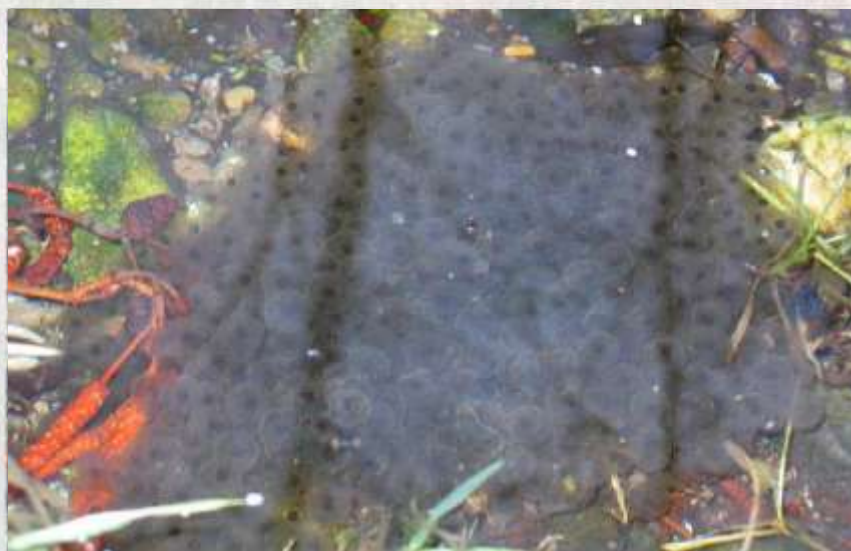
La ponte d'œufs de grenouilles, à découvrir mercredi prochain pour les 9-15 ans.

Avec l'arrivée de la douceur et de la pluie, voici venu le temps de la migration annuelle des amphibiens. Dans le cadre de son programme « Crapauds, grenouilles et Cie », l'Observatoire de la nature propose différentes manifestations, dont des animations le mercredi pour les 9-15 ans.