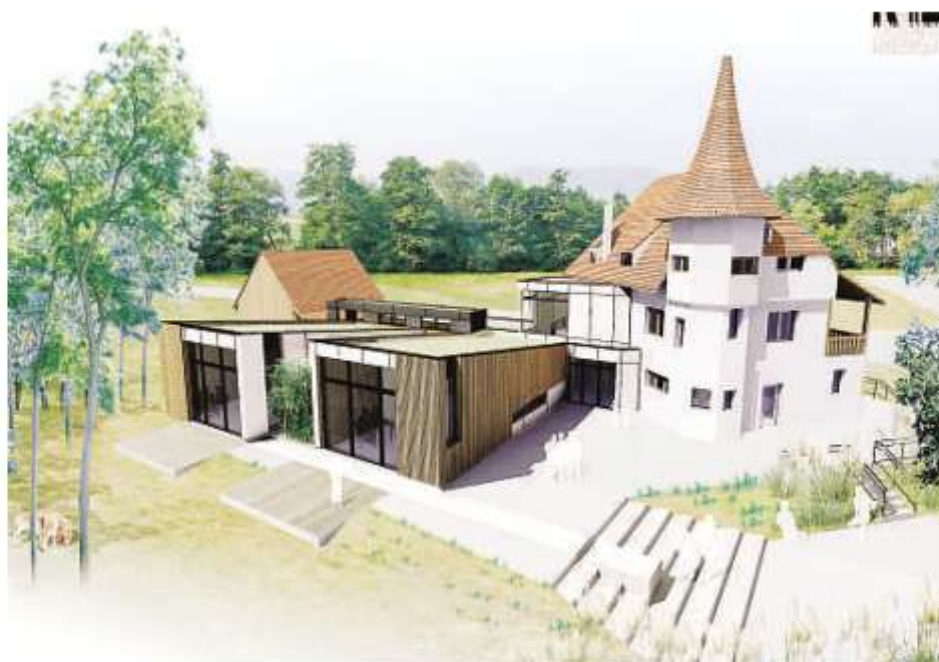
Voilà à quoi ressemblera le site du Neuland à l'horizon 2009. (Documents fournis par Lapernelle et Koscielski architectes)

Le nouveau bâtiment s'étendra sur 225m 2 . Avec, au rez-de-chaussée, ses espaces pédagogiques. Un soin particulier sera apporté à la