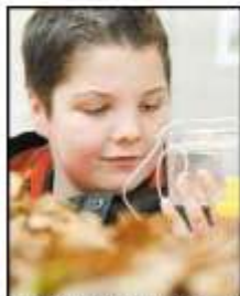
Quelle bestiole y a-t-il donc dans cette boîte ?