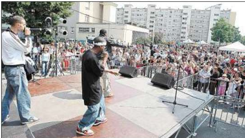
J Freed, l'un des groupes qui s'entraîne régulièrement au studio du Pacific. Encore clément, le ciel s'est malheureusement assombri en début de soirée.

Gros succès hier pour la 5 e fête de l'Amitié, à Bel-Air. Le public a profité des animations, avant que n'arrivent les têtes d'affiche.